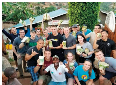
Huye Mountain Coffee

Vanille, Caramel, Pflaume, Sanddorn, roter Apfel Viel Süsse, samtiges Mundgefühl, cremig und angenehm fließend