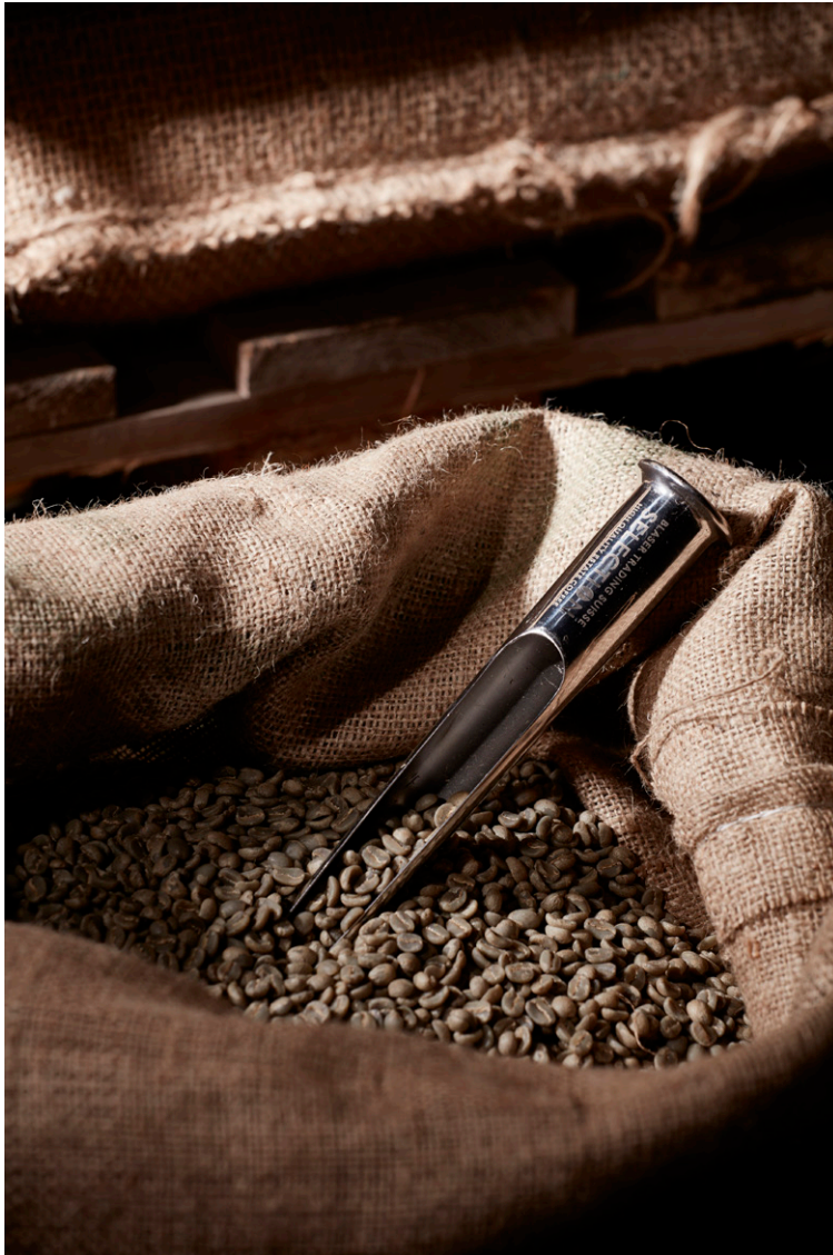
Entnahme Rohkaffeeprobe bei der Blaser Trading AG