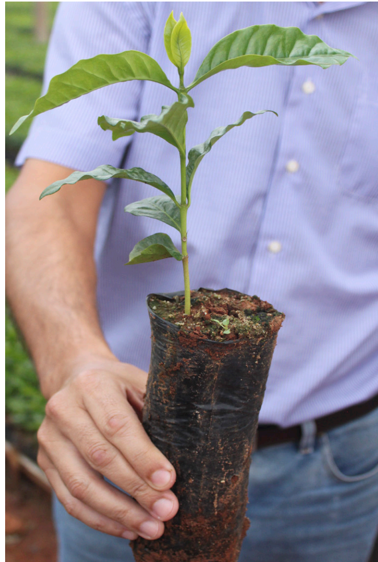
Jungpflanze auf der Fazenda Sertãozinho in Brasilien