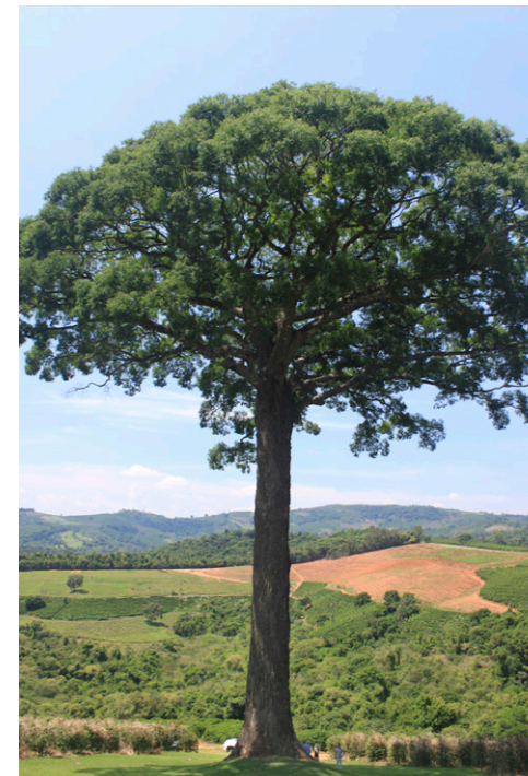
Dieser mindestens 1'500jährige Jequitiba-Baum auf der Fazenda Sertãozinho in Brasilien ist noch heute ein wichtiger Schatten-spender für Kaffeepflanzen.