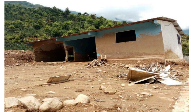
Zerstörtes Gesundheitszentrum in El Boquerón 2020

Heute: Die Bauarbeiten sind fast abgeschlossen und das neue, grössere Gesundheitszentrum konnte im März 2022 eröffnet werden. Mehr über das Projekt erfahren Sie in unserem Blogbeitrag .